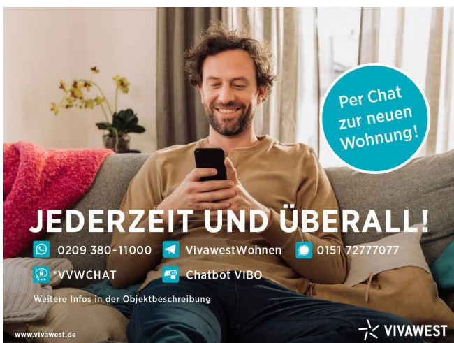
Kontakt per Messenger!