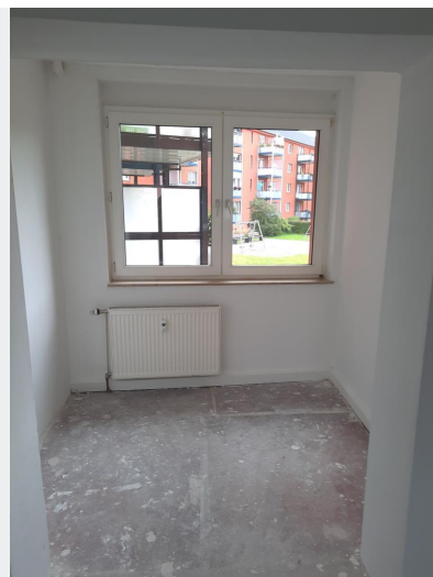
Nische am Wohnzimmer